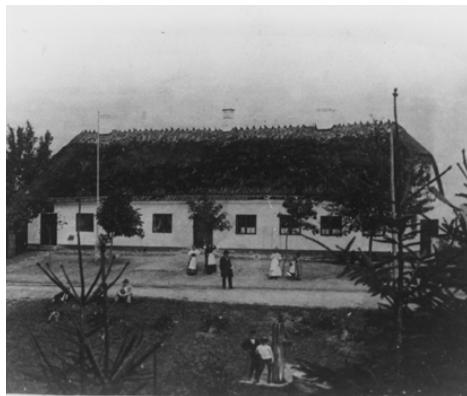
H.C. Lumbyes Vej 52. Rytterskolen fra omkring 1890.

Det første valg blev foranstaltet af en komite udpeget af amtmanden. Senere stod sogneforstanderne selv for valgene. Et valg skulle finde sted ved årets slutning. Man skulle i god tid udarbejde og fremlægge lister over de stemmeberettigede og valgbare mænd. Foruden det med hartkornet skulle man være fyldt 25 år for at kunne deltage. Valget skulle bekendtgøres ved kirkestævne, dvs. efter gudstjenesten. Selve valget fandt sted på Rytterskolen i Lumby. Man kom til stede og afgav mundtligt sin stemme. I den nyvalgte forsamling skulle så det sidste medlem sørge for, at der blev valgt en formand, som hvert år skulle vælges af de øvrige sogneforstandere.