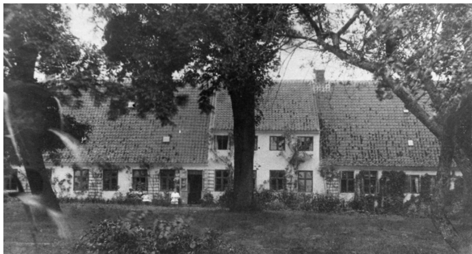
H.C. Lumbyes Vej 40. Lumby gamle Præstegård blev opført i 1739, ombygget i 1804, og nedrevet i 1951