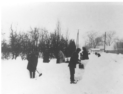
Sne ved præstegården og snerydning i Grønnegyden 148 ud for "Trekanten og det gamle mejeri"

række til, kan man for betaling af 1 kr. og 30 øre dagligt ansætte folk til snekastning.