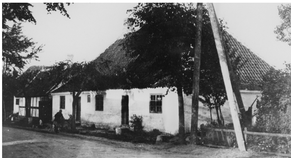
H.C. Lumbyes Vej 34. Eilschous Hospital bygget i 1780 som velgørende institution for fattige (Fattighus)

bejde med mølleren korn, der for en lav pris blev videresolgt til de fattige.